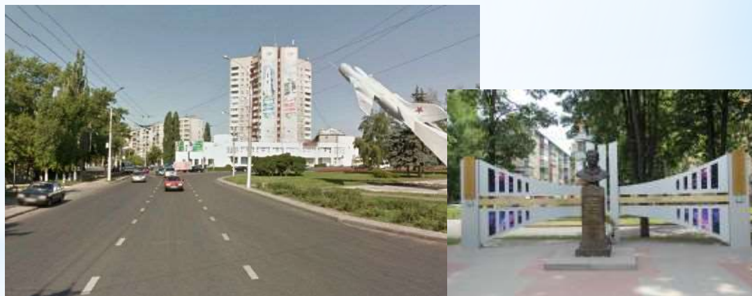
Улица Гагарина. Памятник Гагарину